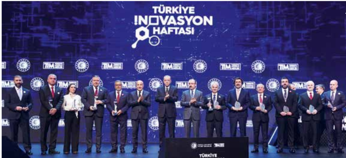
Cumhurbaşkanı Recep Tayyip Erdoğan, Türkiye'nin inovasyon şampiyonlarını ödüllendirirken Türkiye İnovasyon Haftası'na destek sağlayan kuruluşların plakelerini verdi.

vanma sanayisinden örnekler vererek anlatan Cumhurbaşkanı Recep Tayyip Erdoğan, başarı öykülerinin havacılıktan enerjiye, otomotivden yazılıma, bankacılıktan iletişime kadar birçok sektörde yaşandığına vurgu yaptı. Cumhurbaşkanı Erdoğan, "Katma değer üreten, markalı, özgün tasarımlı ve inovatif ürünlerle dünya pazarlarında boy gösteren bir Türkiye olmamızın önünde hiçbir engel yoktur. İnovasyon ve teknolojik dönüşüm, üretim ve ihracat hedeflerimiz için kilit öneme sahip araçlardır. Üretim zenginliği, altyapı, nitelikli insan kaynağı ve dünyanın her yerine ihracat imkanı gibi pek çok avantaja sahibiz. Bu yüzden mevcut tüm avantajlarımızı kullanarak ihracat sepetimizdeki katma değerli ürünlerin çeşitliliğini artırmalıyız." dedi.