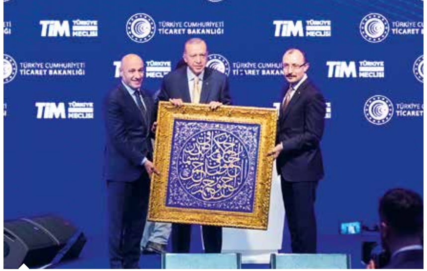
Ticaret Bakanı Mehmet Muş ve TIM Başkanı Mustafa Gültepe, ihracat rakamlarının açıklandığı toplantının sonunda Cumhurbaşkanı Recep Tayyip Erdoğan'a hat sanatı tablosu hediye etti.

Türkiye'nin, dünyanın en çok ihracat yapan ilk 10 ülkesi arasında yerini almasını ana hedef olarak belirlediklerini duyuran Cumhurbaşkanı Erdoğan, ihracatçıların finansmana erişimini kolaylaştırmayı ve teminat sorunlarını çözmeyi hedefleyen İhracatı Geliştirme Anonim Şirketi'nin (İGE A.Ş.), geçen mart ayından bu yana 5 bin 500'e yakın ihracatçıya 20 milyar lira ihracat kredisi kefaleti