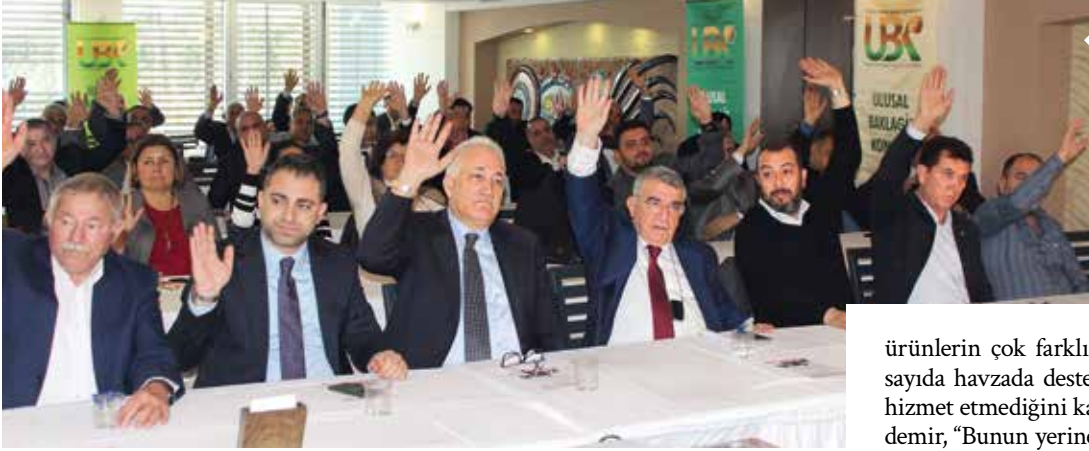
Ulusal Bakliyat Konseyi'nin 11. Olağan Genel Kurulu sektör dinamiklerini buluşturdu.