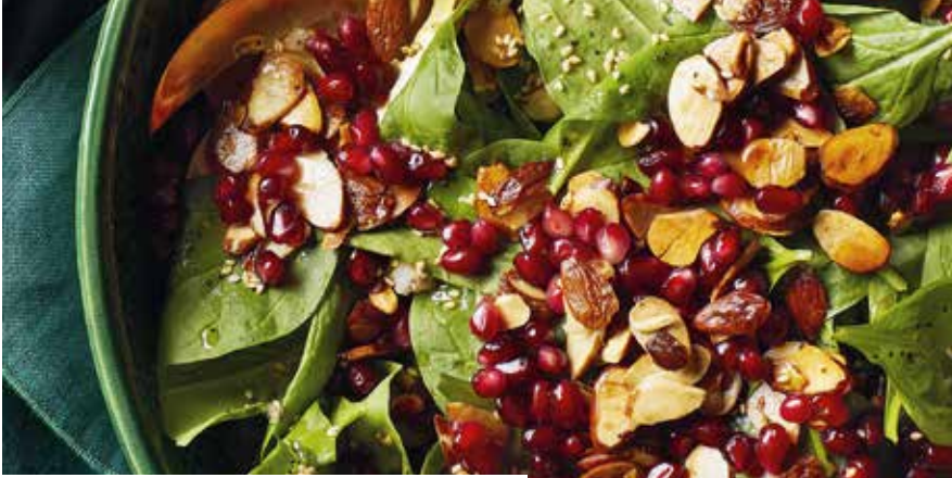
Doğal antioksidan olarak bilinen nar, binbir çeşit faydasıyla şifa deposu olarak görülüyor.